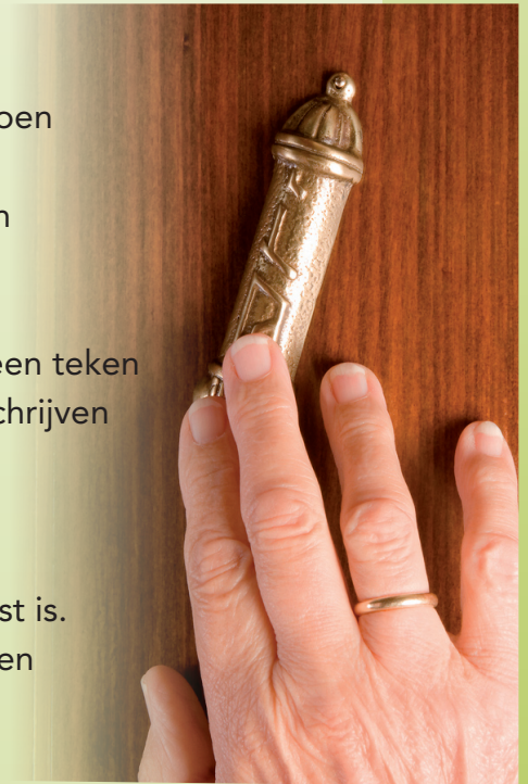
Mezoeza op de deurpost

Deze letters betekenen de naam van de Heere. Het is ook een afkorting van Bewaarder van de poorten van Israël.