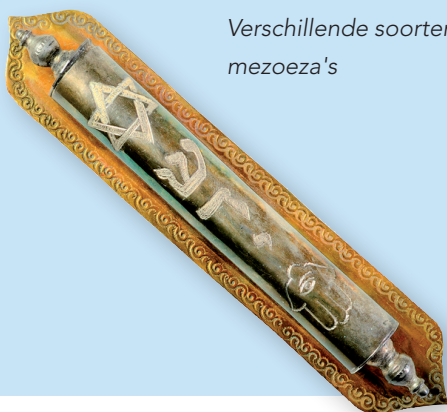
Verskillende soorten mezoeza's